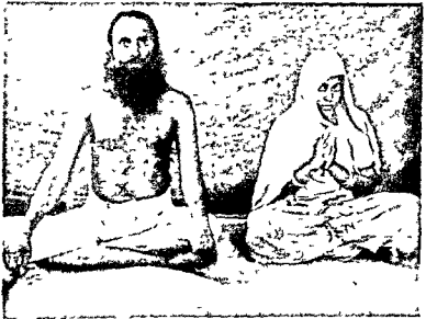
दाता एव मातेश्वरी